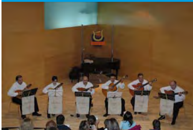
ESPECTACLE TRADICIONAL DE MÚSICA I DANSA ARAGONESA A CÀRREC DE LA RONDALLA JAIME I de l'Asociación Cultural Aragonesa de Salou.